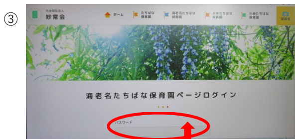
パスワードを入力します パスワード：ebina