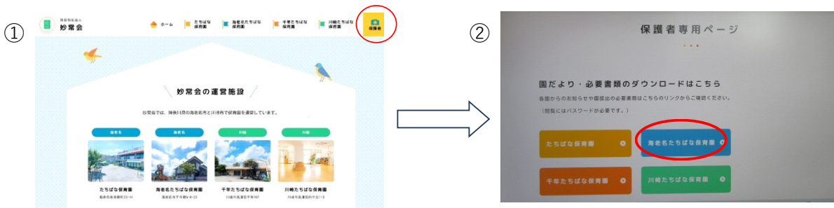
『社会福祉法人 妙常会』から入ります